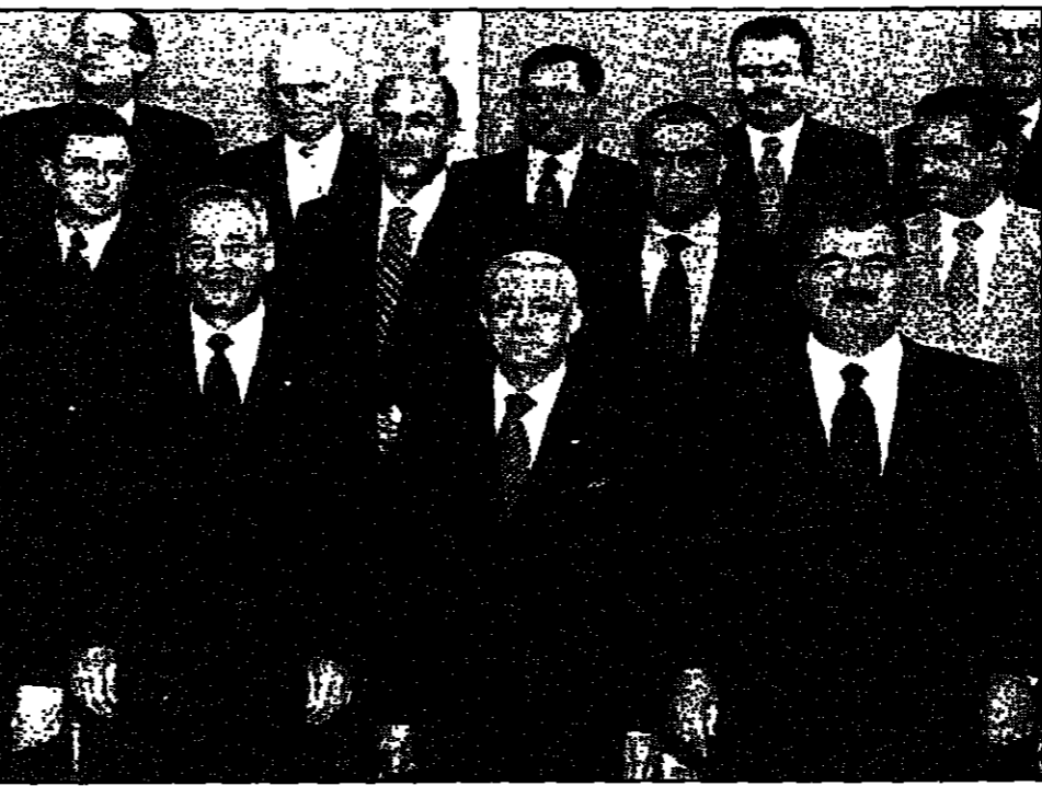
الرئيس الهراوي يتوسط رئيس الحكومة رفيق الحريري ورئيس البرلمان فهد بوري في صيغة تجمعهم مع بقية الوزراء (روجر)

المراقم بزيارات مكوكية بين دمشق وبيروت من اجل حل الازمة